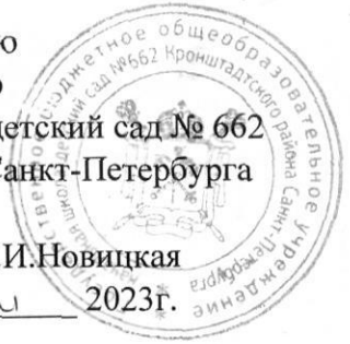
ГРАФИК ЗАКЛАДКИ ОСНОВНЫХ ПРОДУКТОВ ПИТАНИЯ