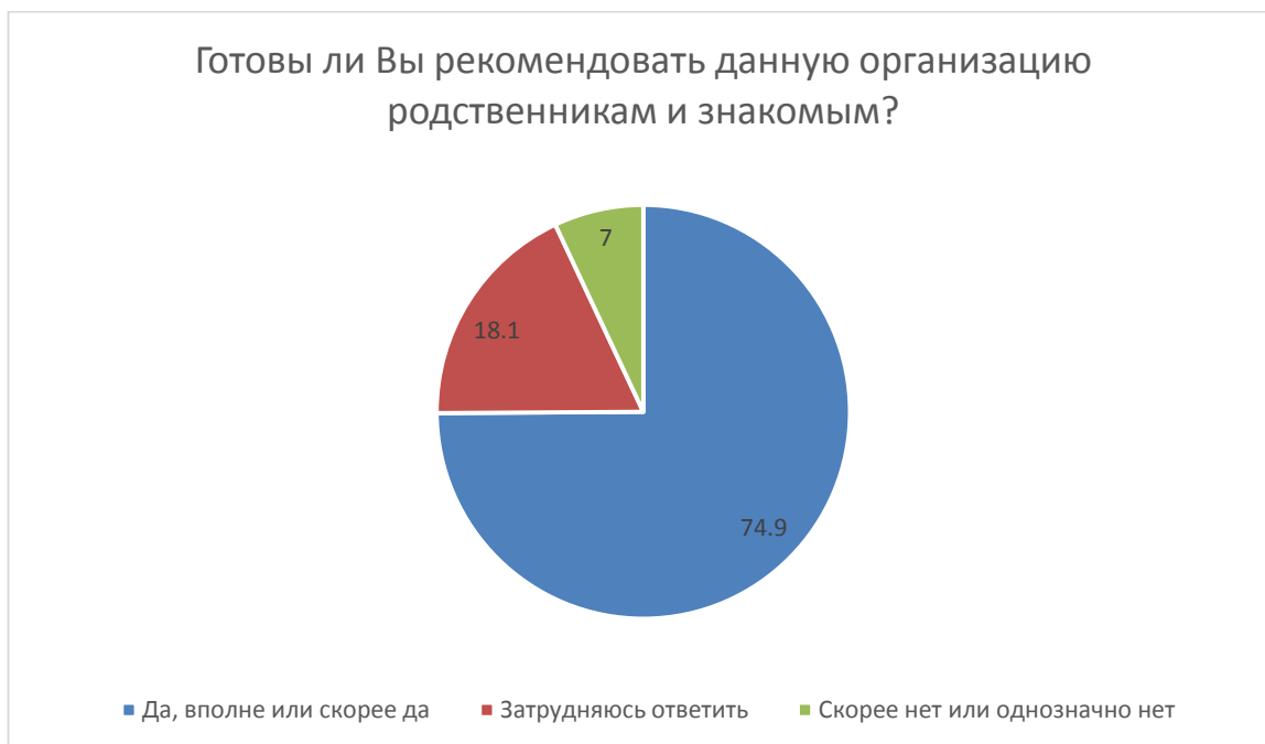
Рис. 6. Доля получателей образовательных услуг, которые готовы рекомендовать школу родственникам и знакомым.

Доля получателей образовательных услуг, которые готовы рекомендовать школу родственникам и знакомым, от общего числа опрошенных получателей образовательных услуг составила 74,9 и% (182 человека) (рис. 6):