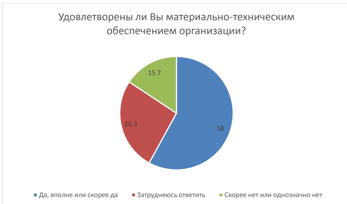
Рис. 4. Доля получателей образовательных услуг, удовлетворенных материально-техническим обеспечением школы.

Доля получателей образовательных услуг, удовлетворенных материально-техническим обеспечением школы, от общего числа опрошенных получателей образовательных услуг составила 58 % (141 человек) (рис. 4):