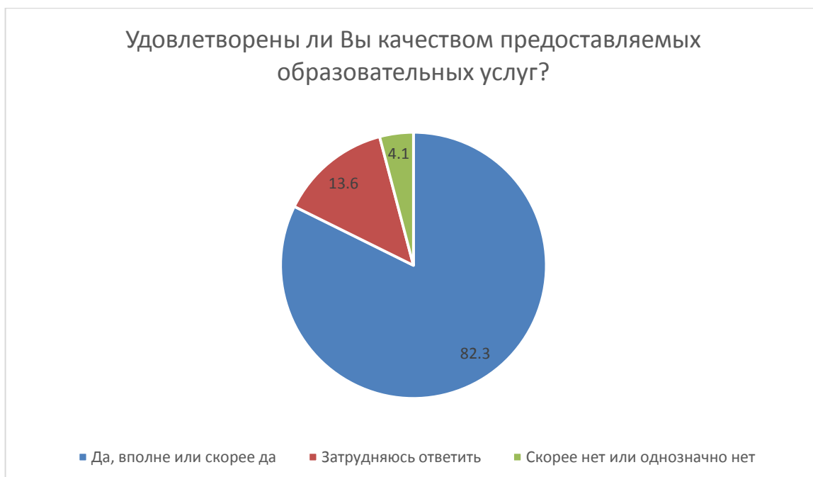
Рис. 5. Доля получателей образовательных услуг, удовлетворенных качеством предоставляемых образовательных услуг школы.

Доля получателей образовательных услуг, удовлетворенных качеством предоставляемых образовательных услуг школы, от общего числа опрошенных получателей образовательных услуг составила 82,3 % (200 человек) (рис. 5):