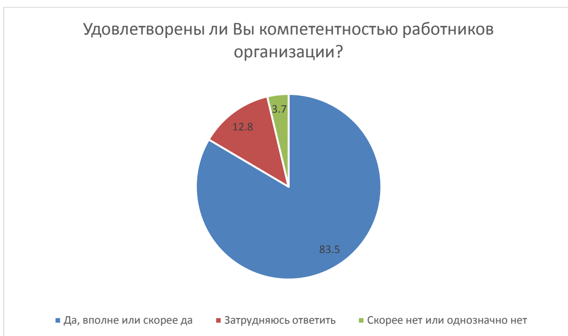
Рис. 3. Доля получателей образовательных услуг, удовлетворенных компетентностью работников школы.

Доля получателей образовательных услуг, удовлетворенных компетентностью работников школы, от общего числа опрошенных получателей образовательных услуг составила 83,5 % (203 человека) (рис. 3):