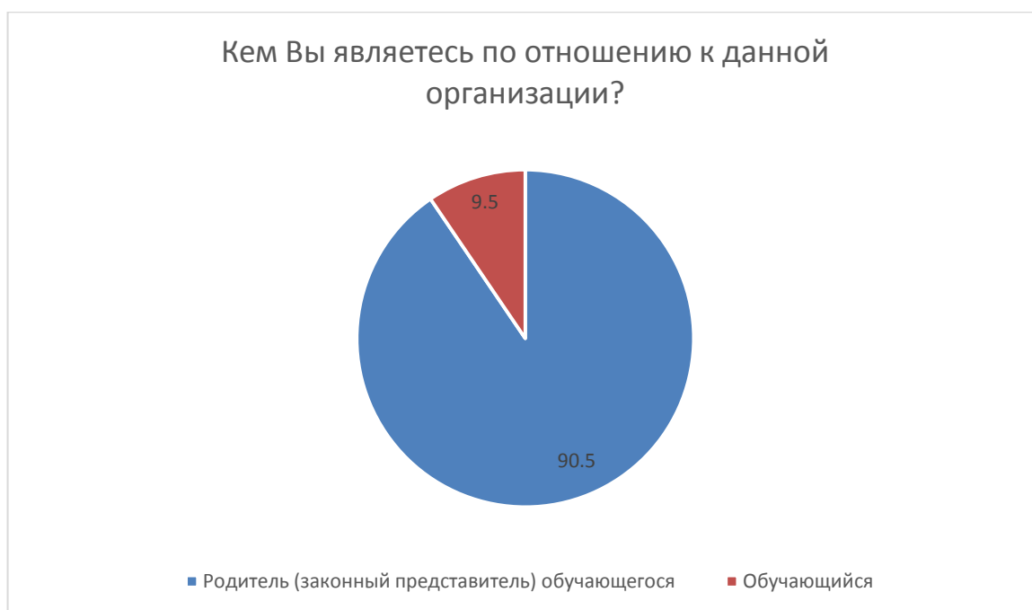
Рис. 1. Получатели образовательных услуг, принявшие участие в анкетировании.

220 человек (90,5 % от общего числа опрошенных) представились в ходе анкетирования как родители, 23 человека (9,5 %) как учащиеся (рис. 1):