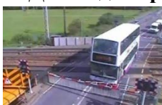
Слайд № 8.